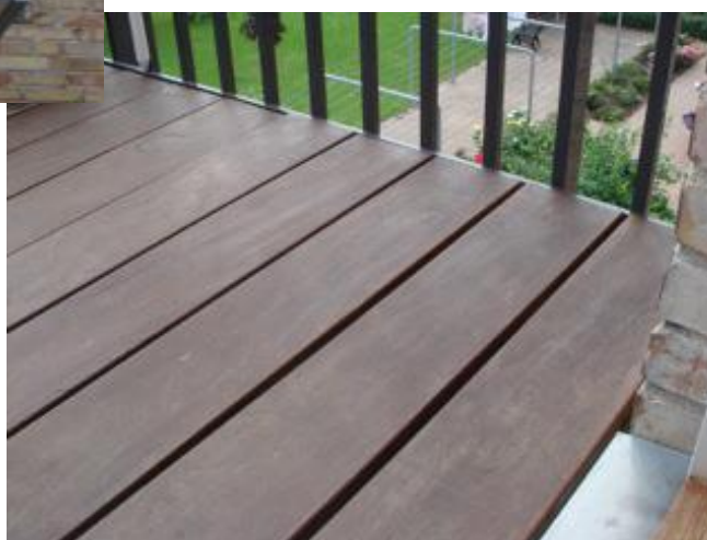
Illustrationsfoto af den relevante type altan fra Altan.dk A/S