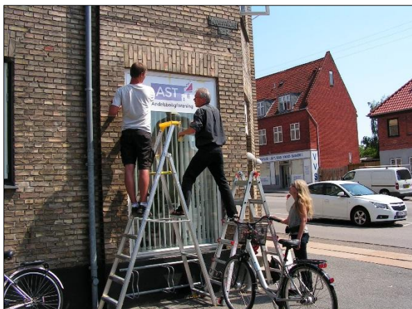
Opsætning af AST-logo på kontorets facade