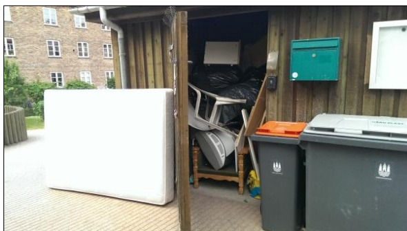
Her er der ekstraarbejde for personalet

Er du i tvivl, henvend dig da på kontoret.