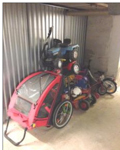
Cykelparkering i vore kældre ...

Personalet vil i løbet af efteråret foretage en oprydning i kældergangene.